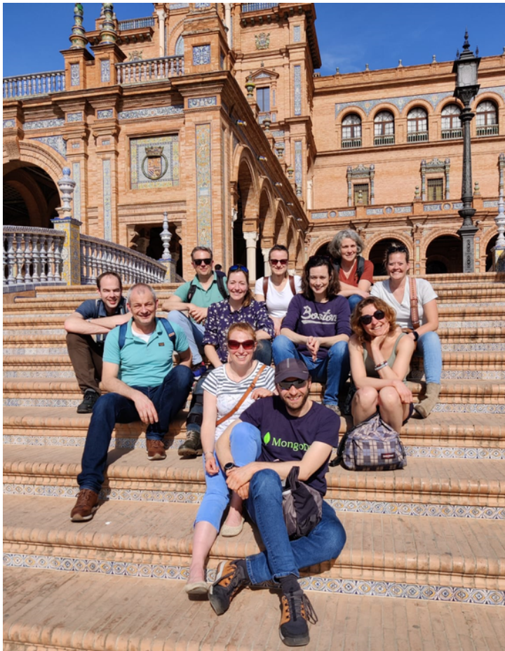
Een gedeelte van de Nederlandse delegatie